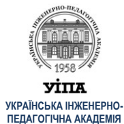
УІПА УКРАЇНЬСЬКА ІНЖЕНЕРНО-ПЕДАГОГІЧНА АКАДЕМІЯ