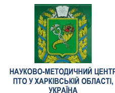
НАУКОВО-МЕТОДИЧНИЙ ЦЕНТР ПТО У ХАРКІВСЬКІЙ ОБЛАСТІ, УКРАЇНА