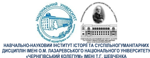
НАВЧАЛЬНО-НАУКОВИЙ ІНСТИТУТ ІСТОРІЇ ТА СУСПІЛЬНОГУМАНІТАРНИХ ДИСЦИПЛІН ІМЕНІ О.М. ЛАЗАРЕВСЬКОГО НАЦІОНАЛЬНОГО УНІВЕРСИТЕТУ «ЧЕРНІВІВСЬКИЙ КОЛЕГІУМ» ІМЕНІ Т.Г. ШЕВЧЕНКА